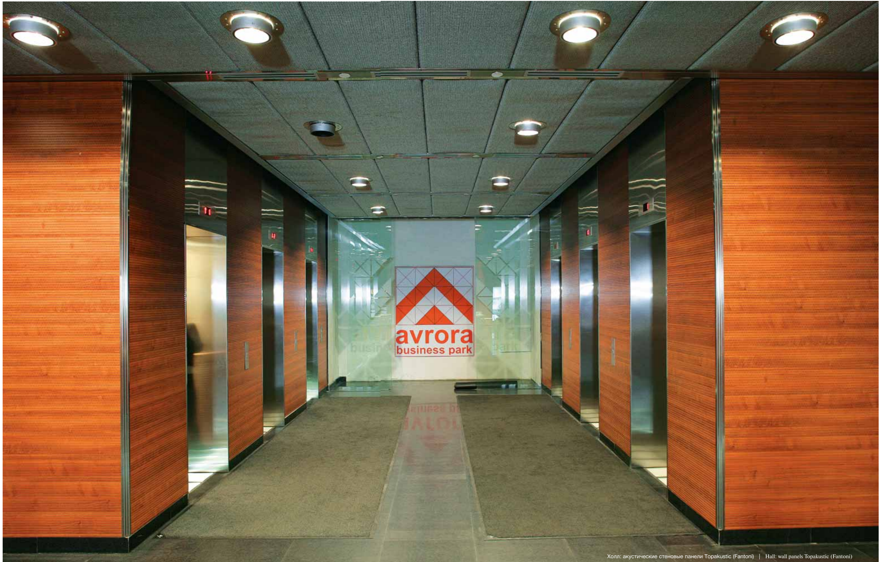
Холл: акустические стеновые панели Topakustic (Fantoni) | Hall: wall panels Topakustic (Fantoni)